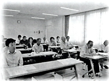
四方樹大学受講風景